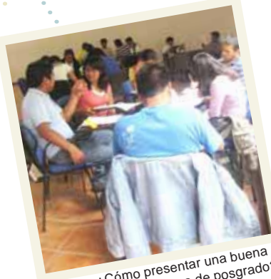
Taller: ¿Cómo presentar una buena solicitud a un programa de posgrado?