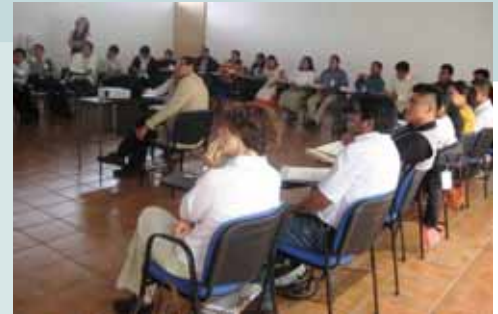
Presentación por la Coordinación IFP Méx-CIESAS