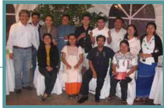
Oaxaca estuvo presente (Ex becarios, becarios y becarios electos IFP)