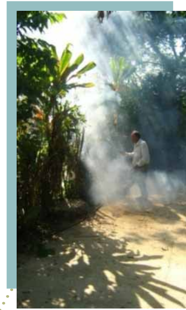
Iluminado por el cielo