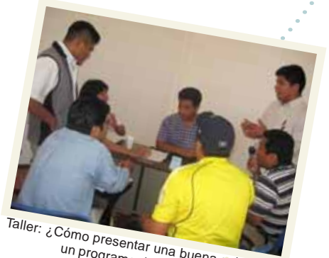
Taller: ¿Cómo presentar una buena solicitud a un programa de posgrado?