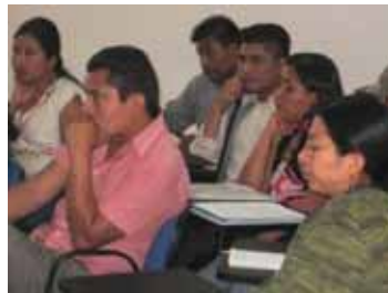
Foro Becarios IFP