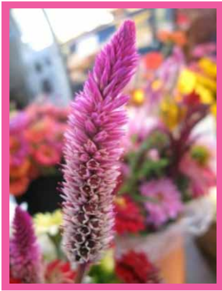
Celosia Plumosa