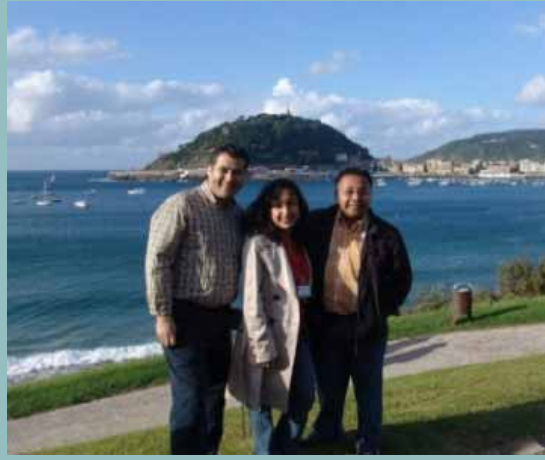
Ascención con amigos en San Sebastián, España