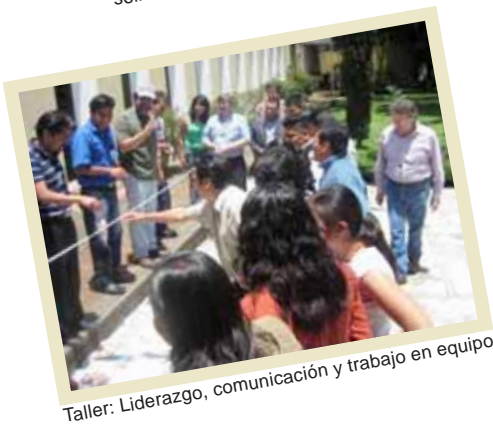
Taller: Liderazgo, comunicación y trabajo en equipo