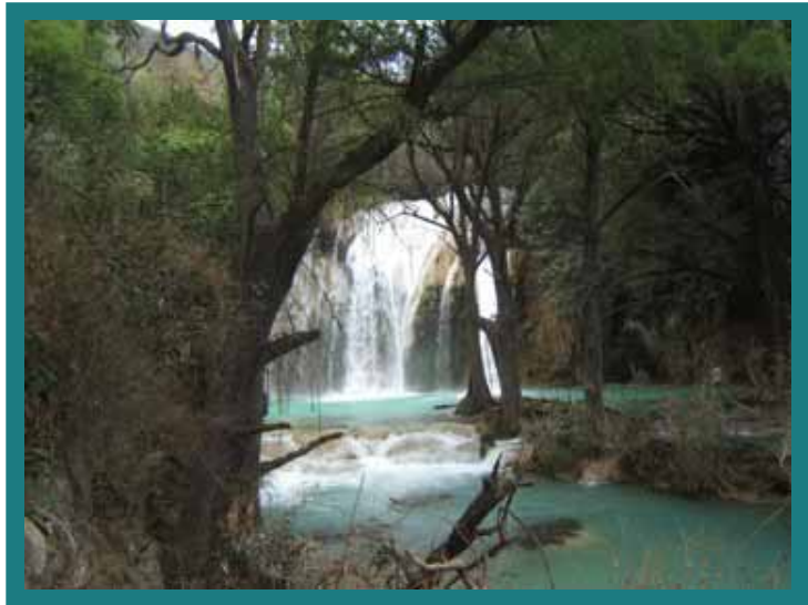
Agua Azul, Chiapas.

El susurro de tu gemir anuncia tu corazón entristecido, lentamente se marchita en el silencio de la inconciencia humana, te desvaneces entre la sombra abandonada del gemir y del eco.