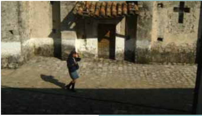
Cuan bonito es mi pueblo